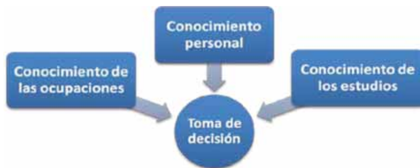
Esquema 1. Ejes vertebradores del Proyecto Vocacional.

En OrientaGuía hemos organizado diversos recursos interactivos a través de un Proyecto Vocacional que llevan a cabo los alumnos de 3º ESO en aproximadamente tres tutorías lectivas. El Proyecto Vocacional utiliza el blog OrientaGuía como plataforma central para, desde aquí, insertar de forma planificada cuestionarios on-line, aplicaciones web, programas informáticos, consultas a través de comentarios al blog,... Para ello contiene varios pasos ordenados y claramente diferenciados: